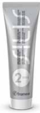
SILIS 2 strong 150 mL pour cheveux crépus / résistants