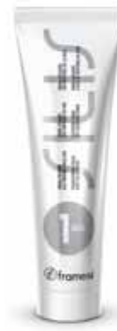
SILIS 1 basic 150 mL pour cheveux normaux