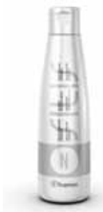
SILIS AQUA-GEL CONDITIONNEUR NEUTRALISANT 150 mL