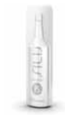
SILIS PROTECTIVE SÉRUM 30 mL